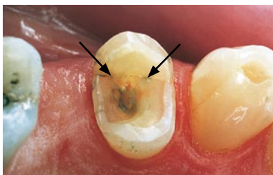
Revne i en lille kindtand, hvor der tidligere har været en stor fyldning.