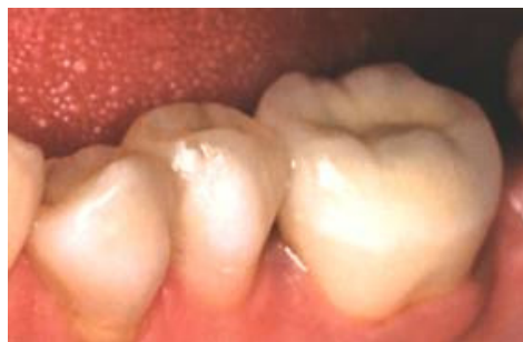
Her forstærket med en MK-krone.

Godt at vide før, under og efter din kronebehandling.