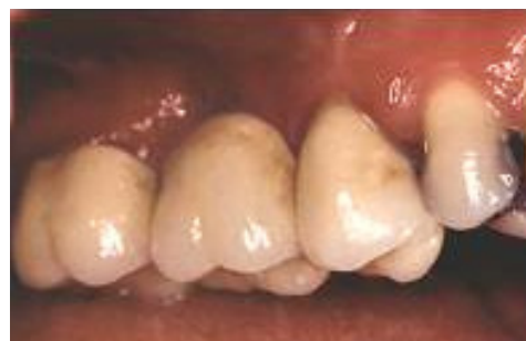
Her ses de beslebne tænder, der skal bære broen, samt den færdige MK-bro på plads i munden.