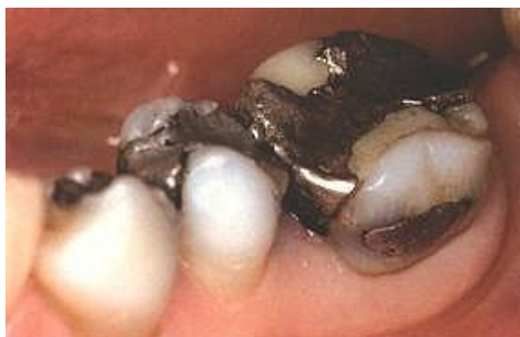
Udboret og svag stor kindtand.